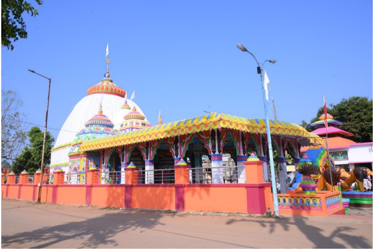
ଶିବ ମନ୍ଦିର ମରାମତି ଓ ନବୀକରଣ, ବଡ଼ସାହି ଗ୍ରାମପଞ୍ଚାୟତ, ଛେଣ୍ଡିପଦା, ଅନୁଗୁଳ