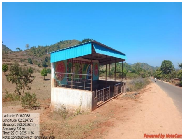
ଟାଙ୍ଗରି ବସ ଷ୍ଟାଣ୍ଡ ନିର୍ମାଣ, କଳାହାଣ୍ଡି