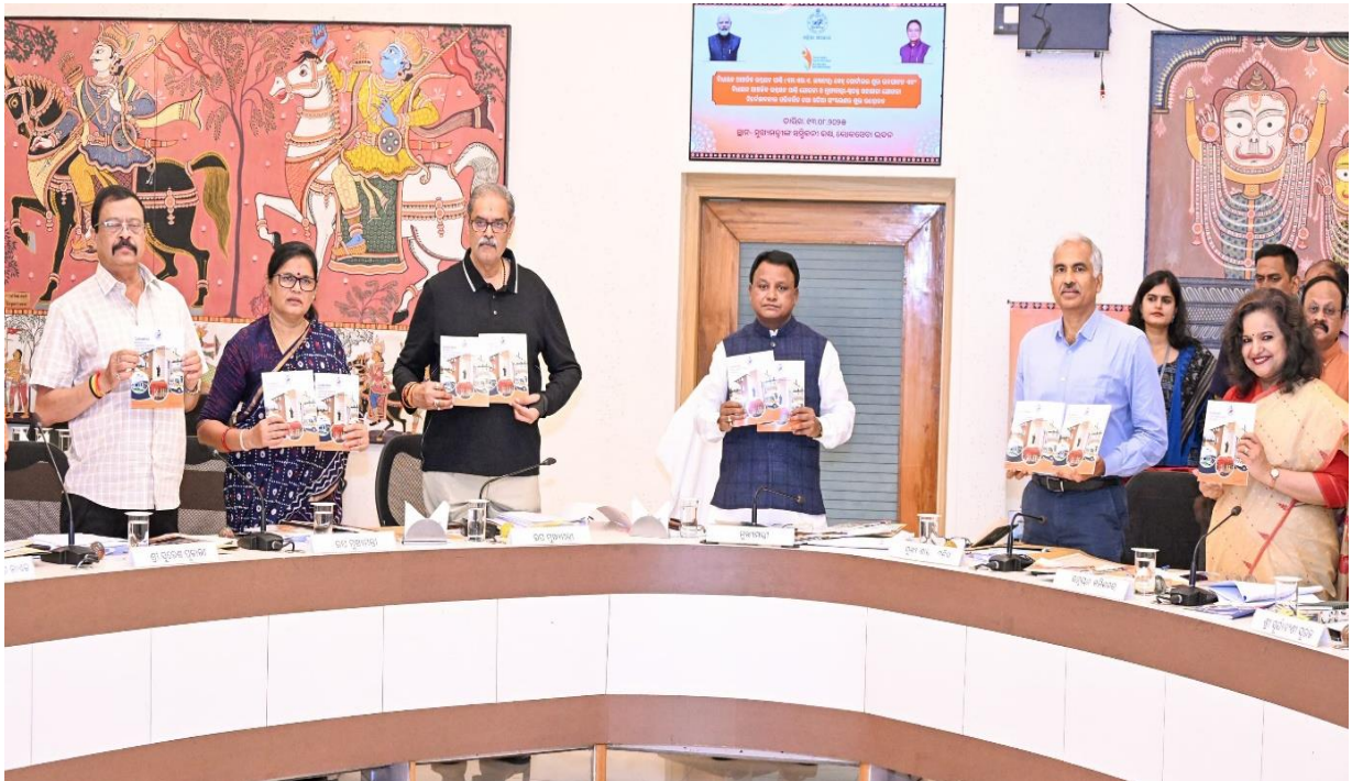
ବିଧାୟକ ଆଞ୍ଚଳିକ ଉନ୍ନୟନ ପାଣ୍ଠି ଏବଂ ମୁଖ୍ୟମନ୍ତ୍ରୀ ସ୍ମୃତକ୍ରମ ସହାୟତା ପାଣ୍ଠିର ପରିବର୍ତ୍ତିତ ନିର୍ଦ୍ଦେଶାବଳୀ (ଓଡ଼ିଆ ଓ ଇଂରାଜୀ ସଂସ୍କରଣ ) ଉଦ୍ଘାଟନ