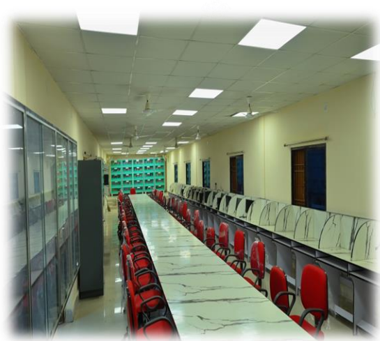
ଇନ୍ଦ୍ରପୁର ଉଚ୍ଚ ବିଦ୍ୟାଳୟର ଉନ୍ନତିକରଣ, ଇନ୍ଦ୍ରପୁର, କେନ୍ଦ୍ରାପଡ଼ା

୨.୪୨ ଏହି ପାଣ୍ଠି ସିଧାସଳଖ ଭାବେ କେନ୍ଦ୍ର ସରକାରଙ୍କ ପାଖରୁ ନୋଡାଲ ଜିଲ୍ଲାପାଳଙ୍କ ପାଖକୁ ଆସିଥାଏ । ବିଭିନ୍ନ ସ୍ତରରେ ଏହି କାର୍ଯ୍ୟର ସମୀକ୍ଷା କରିବା ନିମନ୍ତେ ରାଜ୍ୟ ସରକାର ସମ୍ପୃକ୍ତ ଜିଲ୍ଲାର ଜିଲ୍ଲାପାଳଙ୍କ ଅଧୀନରେ ଜିଲ୍ଲା ସ୍ତରୀୟ ମନିଟରିଙ୍ଗ କମିଟି ଗଠନ କରିଛନ୍ତି । ଭାରତ ସରକାର ଅଦ୍ୟାବଧି ଟ.୩୩୩୫.୦୮ କୋଟି ଟଙ୍କା ଆମ ରାଜ୍ୟକୁ ମଞ୍ଜୁର କରିଅଛନ୍ତି ଏବଂ ଡିସେମ୍ବର ୨୦୨୪ରୁ ୨୦୨୮ରୁ ୯୦.୨୮% ଖର୍ଚ୍ଚ ହୋଇଛି । ଅଦ୍ୟାବଧି ୧୭୨୫୫୮ଟି ପ୍ରକଳ୍ପ ମଞ୍ଜୁର ହୋଇଛି ଯେଉଁଥିରୁ ୧୫୮୭୪୫ (୯୧.୯୪ %) ଟି ପ୍ରକଳ୍ପ ସମ୍ପୂର୍ଣ୍ଣ ହୋଇଛି ।