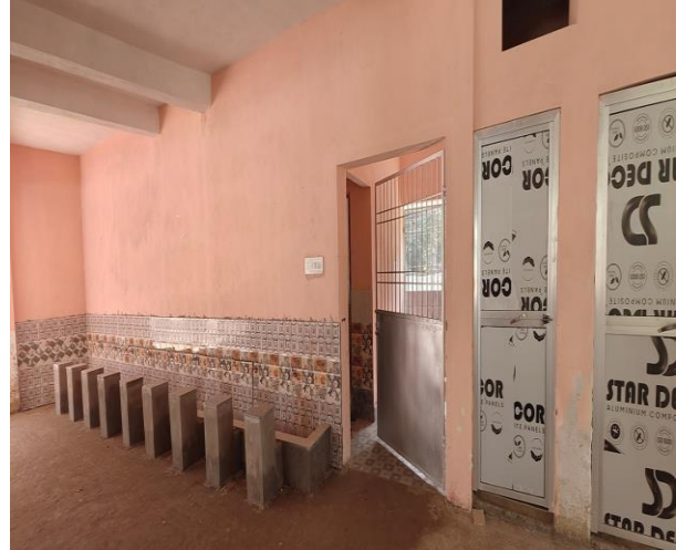
ତୀର୍ଥଯାତ୍ରୀ ସୁବିଧା ଓ ଗୋଷ୍ଠୀ କେନ୍ଦ୍ର ନିର୍ମାଣ, ଭୁଜାଖୁଆ ପୀର (ହଜରତ ସ୍ଵାଲେ), ଝାଡ଼ ନମ୍ବର- ୨, ବାଲେଶ୍ଵର