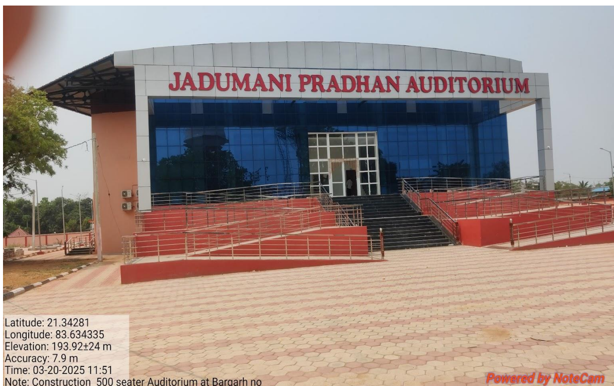
୫୦୦ ସିଟ ବିଶିଷ୍ଟ ପ୍ରେକ୍ଷାଳୟ, ବରଗଡ଼ ପୋରାଞ୍ଜଳ, ବରଗଡ଼