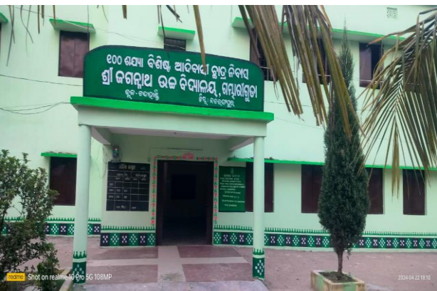
ଗମ୍ଭାରାଗୁଡା, ITDA, ନବରଙ୍ଗପୁର

୨.୨୪ ରାଜ୍ୟ ସରକାରଙ୍କ ନିଜସ୍ୱ ସମ୍ବଳରେ ୨୦୧୭-୧୮ ଆର୍ଥିକ ବର୍ଷରୁ ବାର୍ଷିକ ୧୩୦ କୋଟି ଟଙ୍କା ବ୍ୟୟରେ କେ.ବି.କେ ଜିଲ୍ଲାଗୁଡ଼ିକ ପାଇଁ ଭିଡିଭୁମି ଉନ୍ନୟନ ପାଣି ଯୋଜନା ପ୍ରବର୍ତ୍ତନ କରାଯାଇଛି। ଏହି ଯୋଜନାରେ ୨୦୧୯-୨୦ ରୁ ଏଯାବତ୍, ବିଭିନ୍ନ ବିଭାଗକୁ ୯୭୮.୮୭ କୋଟି ଟଙ୍କା ଜଳସେଚନ, ଆକ୍ରମଣ ଜିଲ୍ଲା ସତକ, ଗୁରୁତ୍ୱପୂର୍ଣ୍ଣ ଆର.ଡି ସତକ, ପାନୀୟ ଜଳ ଯୋଗାଣ ଏବଂ ST / SC ବିଦ୍ୟାଳୟ କୋଠା / ହଷ୍ଟେଲଗୁଡ଼ିକର ବିକାଶ ପାଇଁ ସ୍ଥାୟୀ ଭିଡିଭୁମି କ୍ଷେତ୍ରରେ ବିଭିନ୍ନ ପ୍ରକଳ୍ପ କାର୍ଯ୍ୟକାରୀ ନିମନ୍ତେ ପ୍ରଦାନ କରାଯାଇଛି।