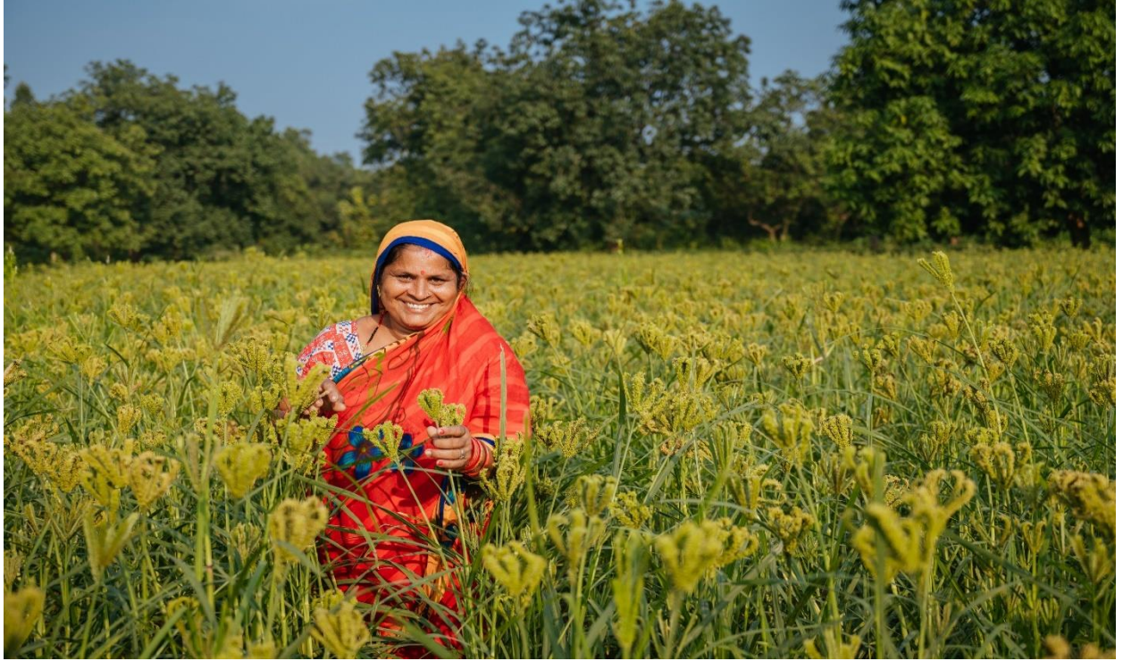
ଫିଙ୍ଗର ମିଲେଟ, ସ୍ଵାସ୍ଥ୍ୟ ଓ ଐତିହ୍ୟର ମିଳନ, ଅନୁଗୁଳ