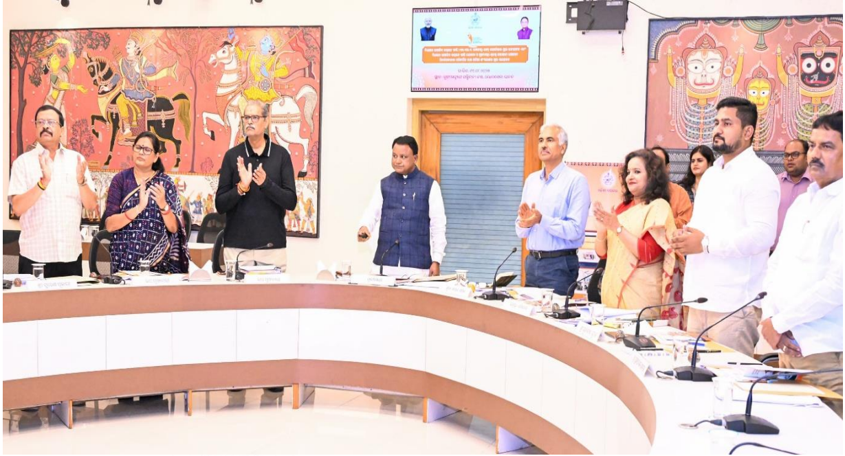
ବିଧାୟକ ଆଞ୍ଚଳିକ ଉନ୍ନୟନ ପାଣ୍ଠି ଖେବ ପୋର୍ଟାଲ ଉଦ୍ଘାଟନ