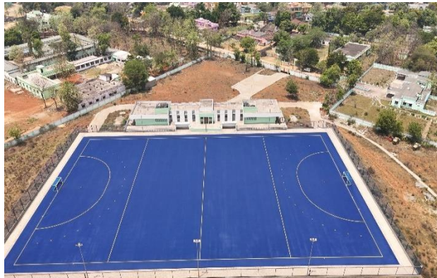
ହକି ପ୍ରଶିକ୍ଷଣ କେନ୍ଦ୍ର , ସୁନ୍ଦରଗଡ଼