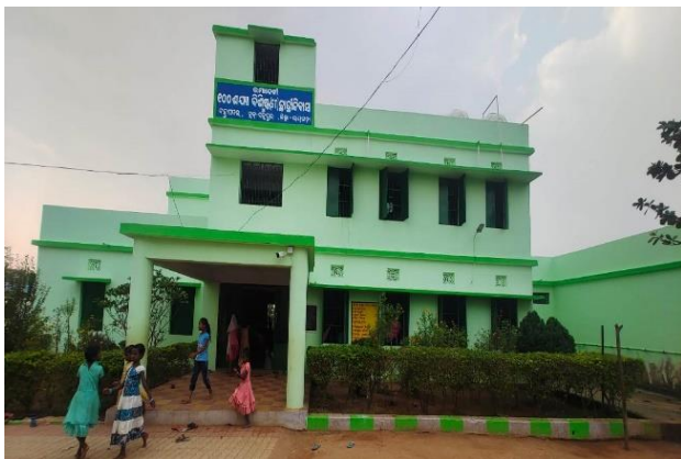
ବାହାପଦର ସେବାଶ୍ରମ ଛାତ୍ରାବାସର ମରାମତି ଓ ନବୀକରଣ, ITDA, ଗୁଣ୍ଡପୁର