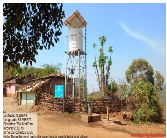
ଗଭୀର ବୋରୱେଲ ଓ ସୌରଶକ୍ତି ଆଧାରିତ ଜଳ ଯୋଗାଣ, କଳାହାଣ୍ଡି