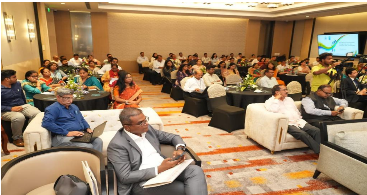
୧୨ ସେପ୍ଟେମ୍ବର, ୨୦୨୫ରେ ଭୁବନେଶ୍ୱରର LYFE ହୋଟେଲରେ ଆୟୋଜିତ "ଲିଙ୍ଗଗତ ଦୃଷ୍ଟିକୋଣ ମାଧ୍ୟମରେ ବିକାଶର ପୁନଃକଳ୍ପନା" ଶୀର୍ଷକ ଏକ ଦିବସୀୟ କର୍ମଶାଳା