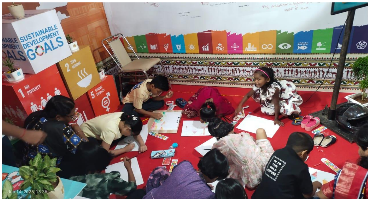
ଭୁବନେଶ୍ୱର ମଧୁସୂଦନ ମାର୍ଗ ଛାତ୍ର ଛାତ୍ରୀଙ୍କୁ ଯୋଗାଇ ଦିଆଯାଇଥିବା ଓଡ଼ିଆ ଭାଷାରେ ରାଜ୍ୟସ୍ତରୀୟ ବିକାଶ ମେଳା, ୨୦୨୫ ଅବସରରେ ଆୟୋଜିତ SDG IEC କିଓସ୍କରେ ଏସଡିଜି ଭିତ୍ତିକ ଚିତ୍ରାଙ୍କନ ପ୍ରତିଯୋଗିତା