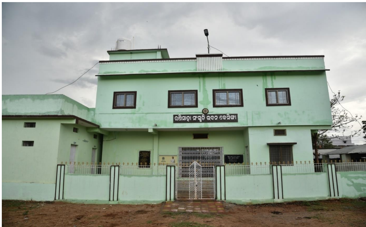
ଶ୍ରୀ ଜଗନ୍ନାଥ ମନ୍ଦିର ନିକଟସ୍ଥ ରକ୍ଷିସାହା ସଂସ୍କୃତି ଭବନ, କେସିଙ୍ଗା