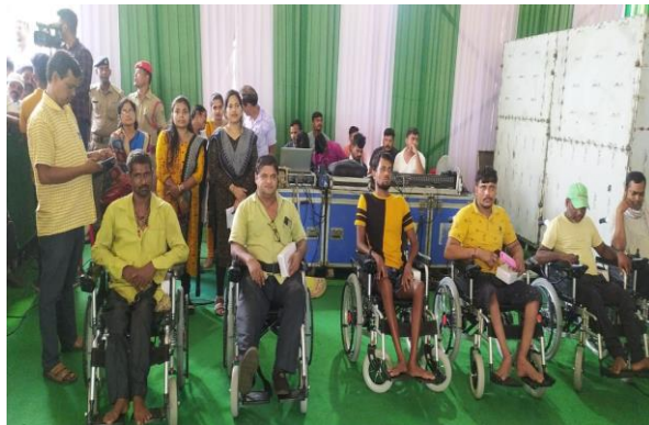
୫୦ ଟି ବ୍ୟାଚେରୀ ଚାଳିତ ଗାଡ଼ି ମାଧ୍ୟମରେ ଗତିଶୀଳତା ଓ ସ୍ୱାଧୀନତା ବୃଦ୍ଧି, ଅନୁଗୁଳ