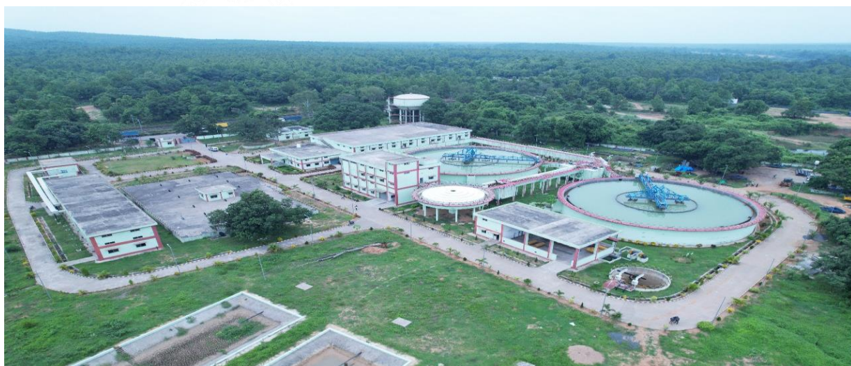
ମେଗା ପାନୀୟ ଜଳ ପ୍ରକଳ୍ପ, ଜଳ ସୁରକ୍ଷା ଓ ଜନସ୍ୱାସ୍ଥ୍ୟ ଦିଗରେ ଏକ ପଦକ୍ଷେପ, ଅନୁଗୁଳ

୭.୧୦ ଅନୁଗୁଳ, ଯାଜପୁର ଓ ଝାରସୁଗୁଡ଼ା ଜିଲ୍ଲାରେ ଡିଏମ୍‌ଏଫ୍ ପ୍ରକଳ୍ପର କାର୍ଯ୍ୟକାରୀତା ସମୀକ୍ଷା ଏବଂ DMF ପ୍ରକଳ୍ପର କାର୍ଯ୍ୟାବଳୀର ସମକାଳୀନ ମୂଲ୍ୟାଙ୍କନ ସମାପ୍ତ ହୋଇଛି ଏବଂ Grant Thornton Bharat LLP ଦ୍ୱାରା ଚୂଡ଼ାନ୍ତ ରିପୋର୍ଟ ଦାଖଲ କରାଯାଇଛି ।