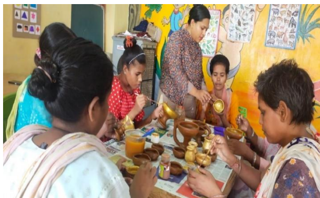
ମହିଳାମାନଙ୍କ ନିମନ୍ତେ ପୁନଃବ୍ୟସ୍ଥାପନ କାର୍ଯ୍ୟକ୍ରମ, ବକ୍ଷତା ନିର୍ମାଣ ଓ ଆତ୍ମବିଶ୍ୱାସ ପୁନଃସ୍ଥାପନ, ଅନୁଗୁଳ