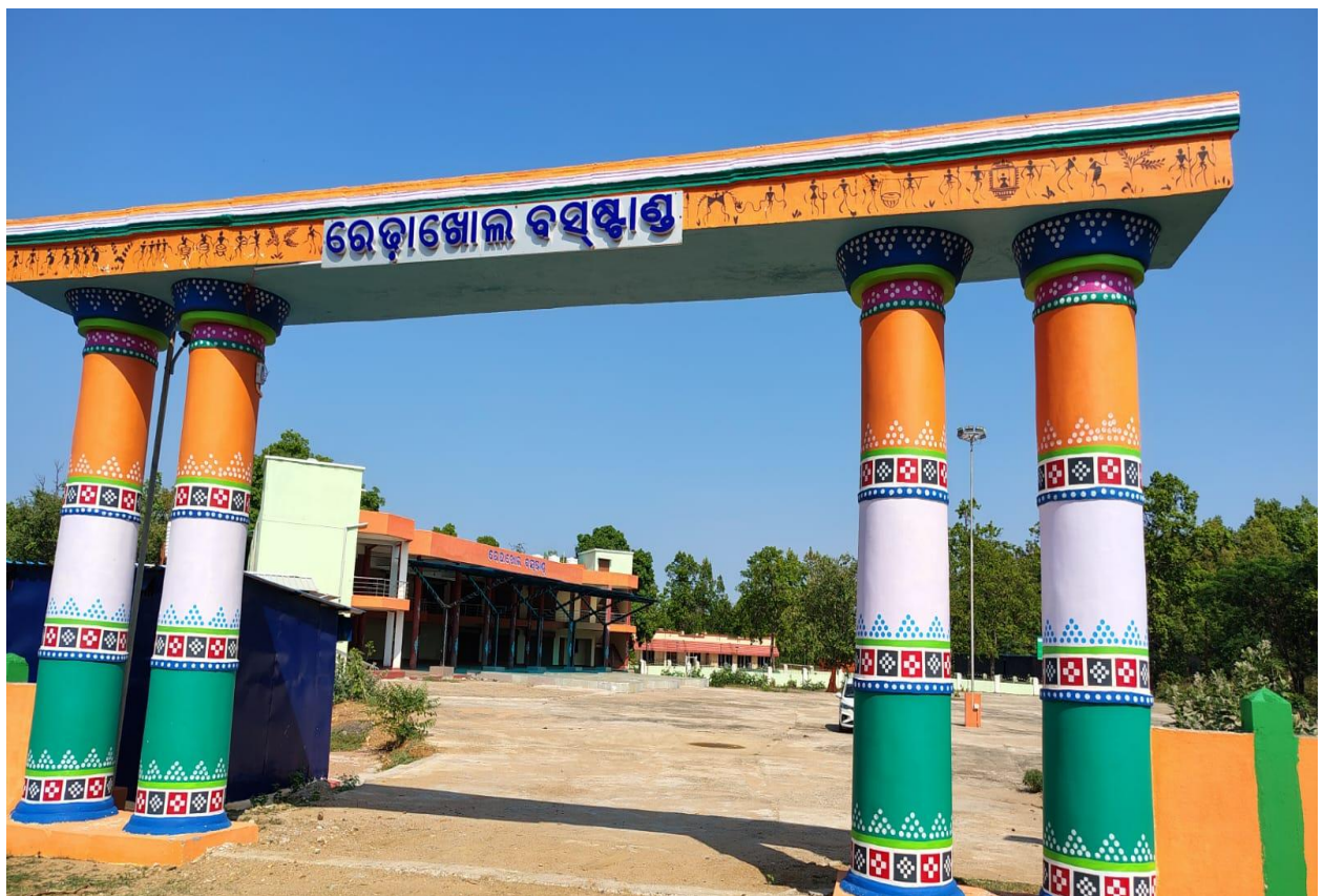
ରେଢ଼ାଖୋଲ ବସଷ୍ଟାଣ୍ଡ, ରେଢ଼ାଖୋଲ ଏନ.ଏ.ସି