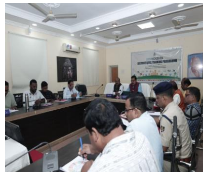
ଜିଲ୍ଲାମାନଙ୍କରେ ଆୟୋଜିତ SDG ସମ୍ବନ୍ଧୀୟ ଜିଲ୍ଲା ଓ ବ୍ଲକ୍ ସ୍ତରୀୟ ପ୍ରଶିକ୍ଷଣ