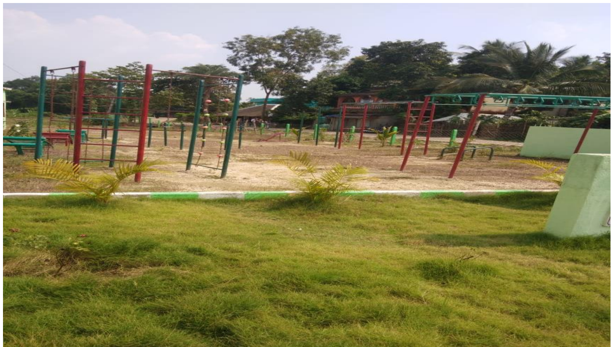
ବନବିଷ୍ଣୁପୁର ଉଚ୍ଚ ବିଦ୍ୟାଳୟର ଖେଳପଡ଼ିଆ ବିକାଶ, ସୋର, ବାଲେଶ୍ଵର