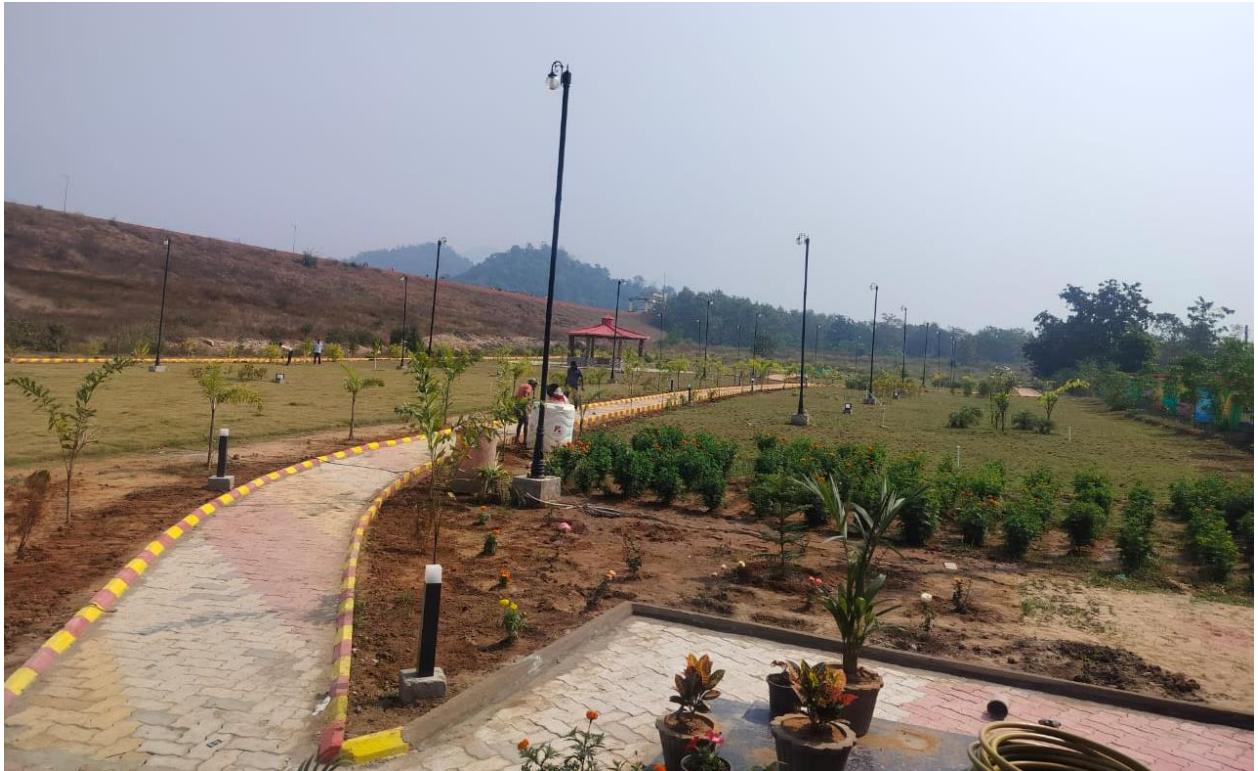
ମଞ୍ଜୋର ଡ୍ୟାମ୍ ଉଦ୍ୟାନ, ଆଠମଲ୍ଲିକ