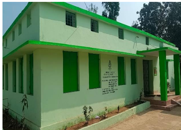
ଶିବପଦର ଆଶ୍ରମ ବିଦ୍ୟାଳୟ କେ.ବି.କେ ଛାତ୍ରାବାସର ମରାମତି ଓ ନବୀକରଣ, ITDA, ଗୁଣ୍ଡପୁର