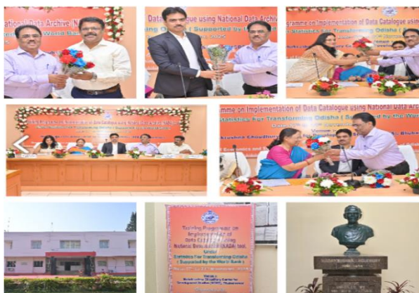
୩୦-୩୧ ଅକ୍ଟୋବର, ୨୦୨୫ରେ OSCRGP ଅଧୀନରେ NADA Tool ବ୍ୟବହାର କରି ତାତ୍କାଳୀନ କାର୍ଯ୍ୟାବଳୀ ନିମନ୍ତେ ପ୍ରଥମ ପର୍ଯ୍ୟାୟ ପ୍ରଶିକ୍ଷଣ