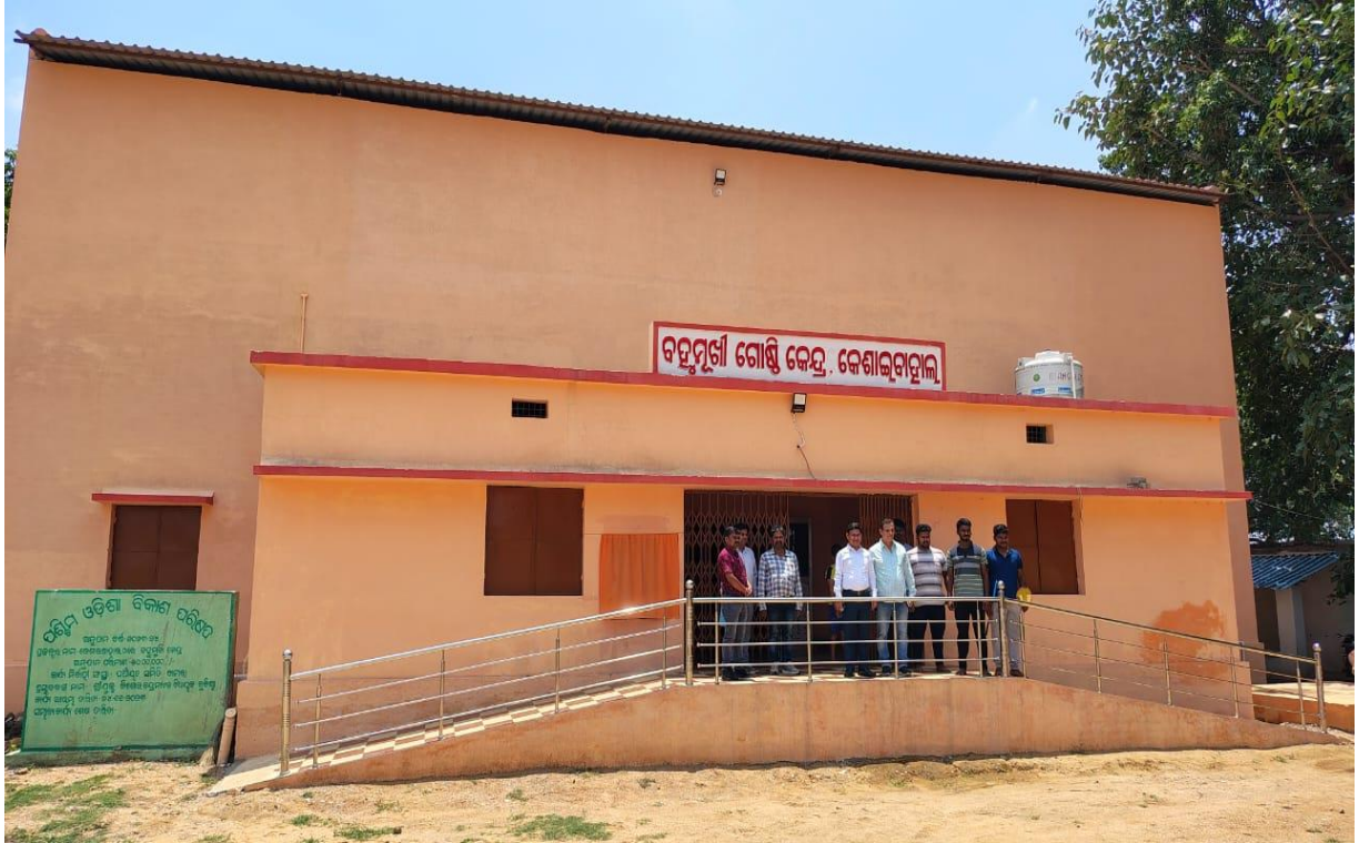
ବହୁମୁଖୀ ଗୋଷ୍ଠୀ କେନ୍ଦ୍ର, କୋଶାଇବାହାଲ, ବାମରା, ସମ୍ବଲପୁର