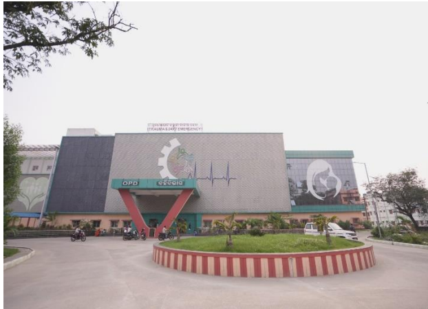
ଜିଲ୍ଲା ମୁଖ୍ୟ ଚିକିତ୍ସାଳୟର ୧୦୦ ଶଯ୍ୟା ବିଶିଷ୍ଟ ICU ହ୍ରମା କେନ୍ଦ୍ରର ସେଣ୍ଟର, ଅନୁଗୁଳ