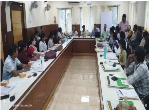
RIPAE&S OIରେ NSS ସମ୍ବନ୍ଧୀୟ DPMU ସ୍ତରୀୟ ପ୍ରଶିକ୍ଷଣ