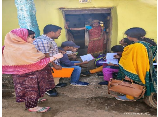
ସ୍ୱାସ୍ଥ୍ୟ ଏବଂ DTES ସମ୍ବନ୍ଧୀୟ ୮୦ତମ ରାଉଣ୍ଡ କ୍ଷେତ୍ର ସର୍ବେକ୍ଷଣ