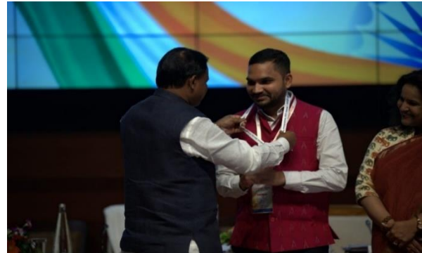
ରାଜ୍ୟ ସ୍ତରୀୟ "ସମ୍ପୂର୍ଣ୍ଣତା ଅଭିଯାନ ସମ୍ମାନ ସମାରୋହ"