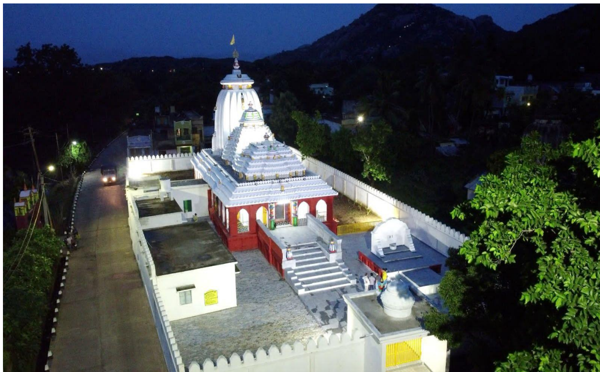
ଚିକିଟିଗଡ଼ ଜଗନ୍ନାଥ ମନ୍ଦିରର ମରାମତି ଓ ନବୀକରଣ, ଚିକିଟି NAC, ଗଞ୍ଜାମ