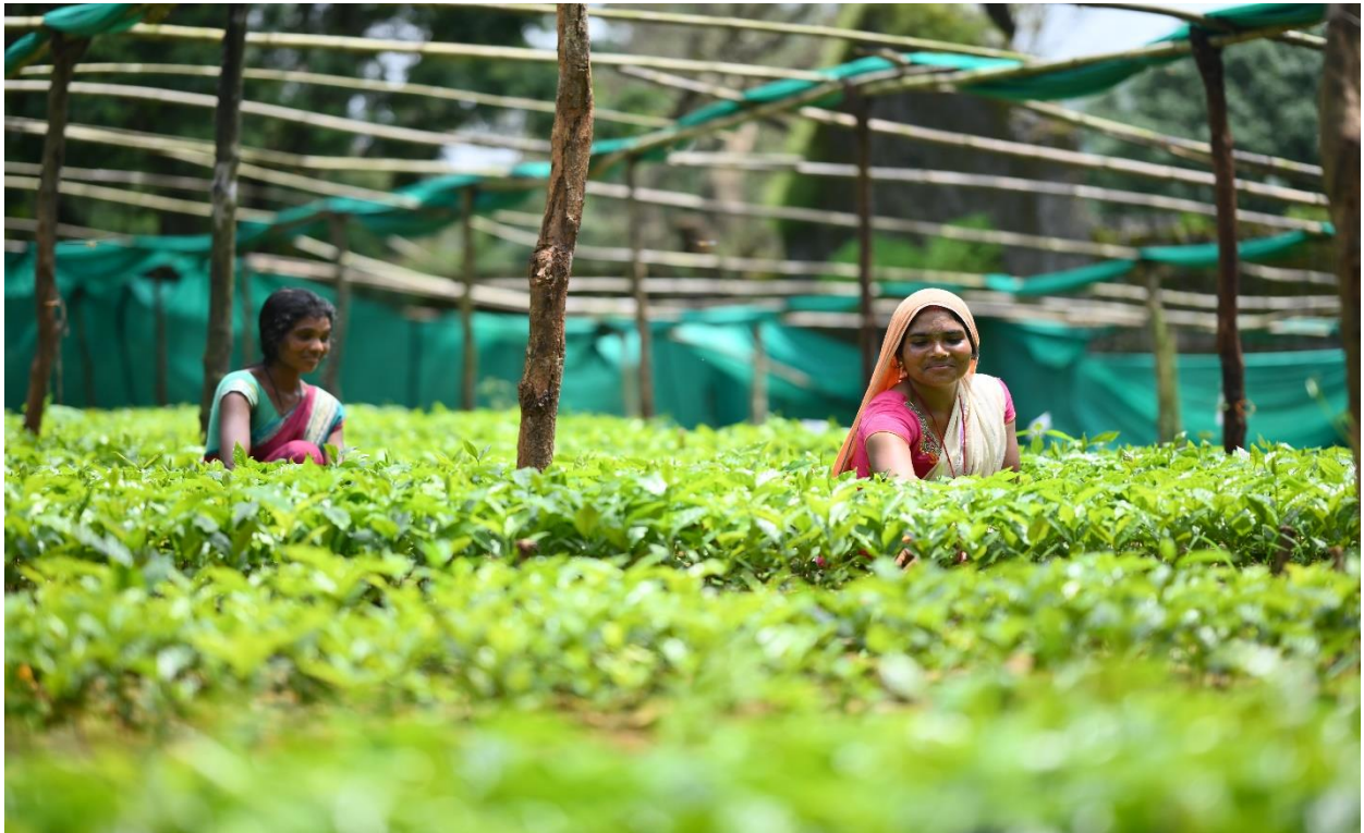
ସ୍ୱୟଂ ସହାୟକ ଗୋଷ୍ଠୀ ଦ୍ୱାରା କୋରାପୁଟରେ ନିର୍ମିତ ବିପ୍ଳବ