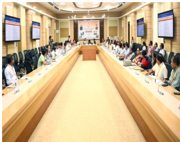
୨୯ ଜୁନ, ୨୦୨୫ ରୁ ୧ ଜୁଲାଇ, ୨୦୨୫ ପର୍ଯ୍ୟନ୍ତ ଜିଲ୍ଲା ଘରୋଇ ଉତ୍ପାଦ ଆକଳନ ସମ୍ବନ୍ଧୀୟ କର୍ମଶାଳା