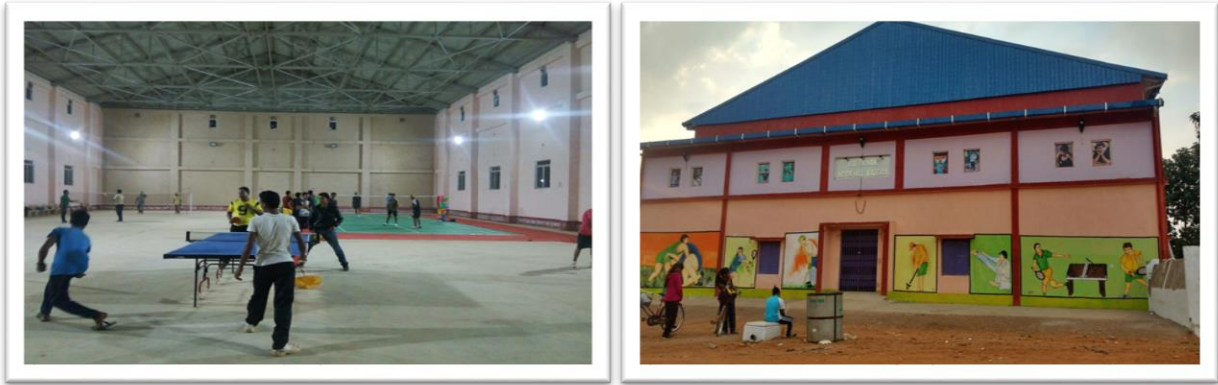
ଇନଡୋର ସ୍ପୋର୍ଟ୍ସ ହାଲ୍ ତଥା ଜିମ୍ନାସିଅମ ନିର୍ମାଣ, ବାଲିଗୁଡା ULB

ଗଜପତି ବିକାଶ ଯୋଜନା (ପୂର୍ବରୁ କାର୍ଯ୍ୟକାରୀ ହେଉଥିବା ବିଜୁ କନ୍ଧମାଳ ଓ ଗଜପତି ଯୋଜନା) ଆରମ୍ଭ ହୋଇଥିଲା। ଏହି ଯୋଜନା ମାଧ୍ୟମରେ ବିଜୁଲି, ସତକ,ପାଣି, ଜୀବିକା ଏବଂ ସାମାଜିକ ନିରାପତ୍ତା କାର୍ଯ୍ୟକ୍ରମ ଆଦି କ୍ଷେତ୍ର ସଂପର୍କିତ ପ୍ରକଳ୍ପ ଗୁଡ଼ିକୁ କାର୍ଯ୍ୟକାରୀ କରିବା ପାଇଁ କନ୍ଧମାଳ ଓ ଗଜପତି ଜିଲ୍ଲାକୁ ଅର୍ଥ ଆବଣ୍ଟନ କରାଯାଇଥାଏ। ୨୦୧୯-୨୦ ରୁ ଏଯାବତ୍, ଏହି ଯୋଜନାରେ ୩୩୧୦ ଗୋଟି ଅନୁମୋଦିତ ପ୍ରକଳ୍ପ ପାଇଁ ୧୭୦ କୋଟି ଟଙ୍କା ଆବଣ୍ଟନ କରାଯାଇଛି।