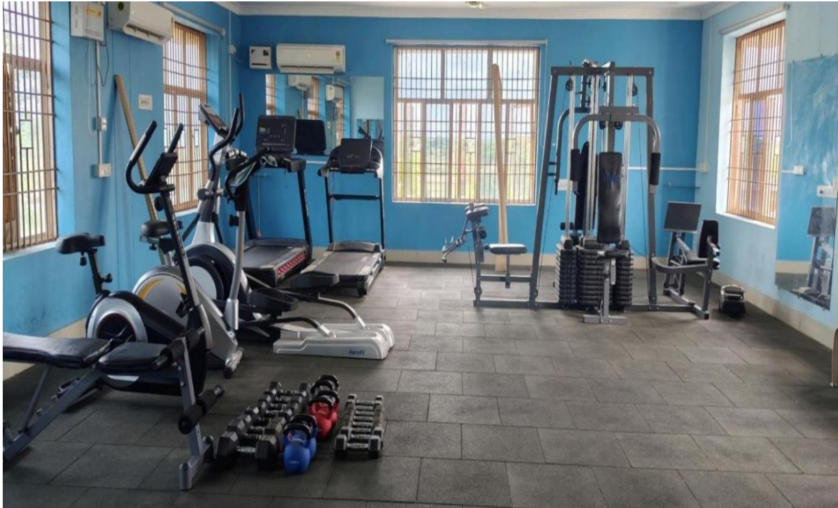
ଫିଟନେସ କ୍ଲବ ନିର୍ମାଣ, ଜିଲ୍ଲାପାଳଙ୍କ କାର୍ଯ୍ୟାଳୟ, ବୌଦ୍ଧ