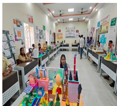
ବିଭିନ୍ନ ଜିଲ୍ଲାରେ ଅନୁଷ୍ଠିତ SDG@School ଅଭିଯାନ