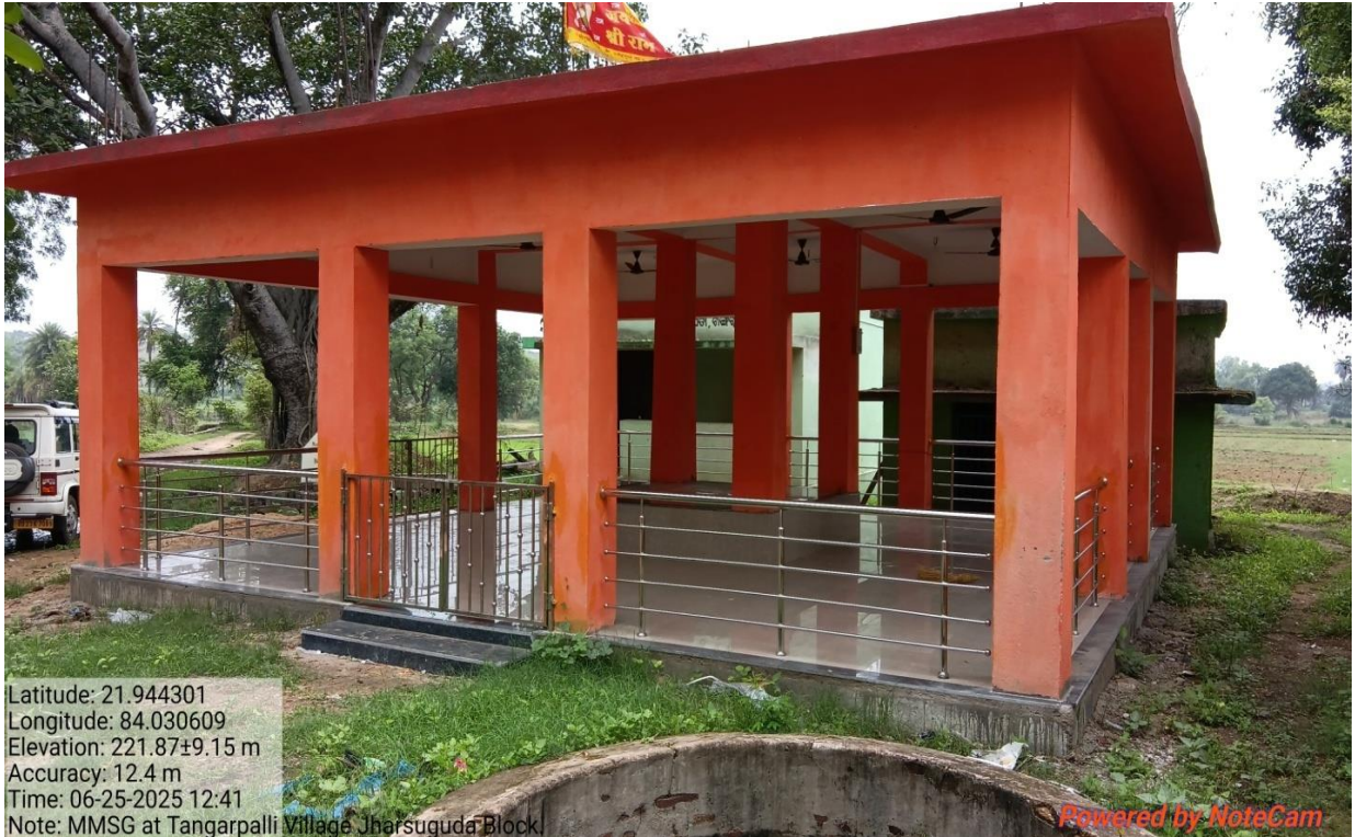
ଝାରସୁଗୁଡ଼ା ଜିଲ୍ଲା ଅନ୍ତର୍ଗତ ଟାଙ୍ଗରପାଲି ଗ୍ରାମ ମଣ୍ଡପ