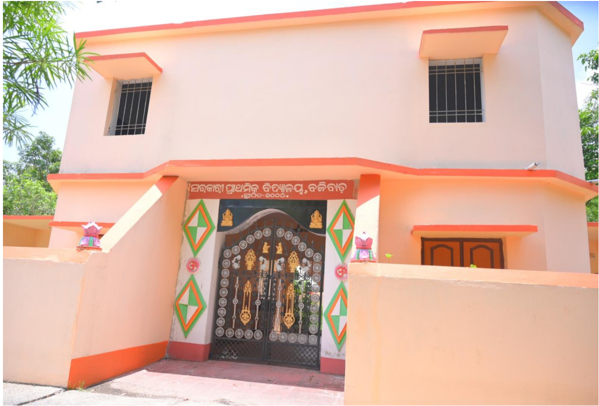
ବଳିବାଡ଼ ସରକାରୀ ପ୍ରାଥମିକ ବିଦ୍ୟାଳୟର ଭିତ୍ତିଭୂମି ବିକାଶ