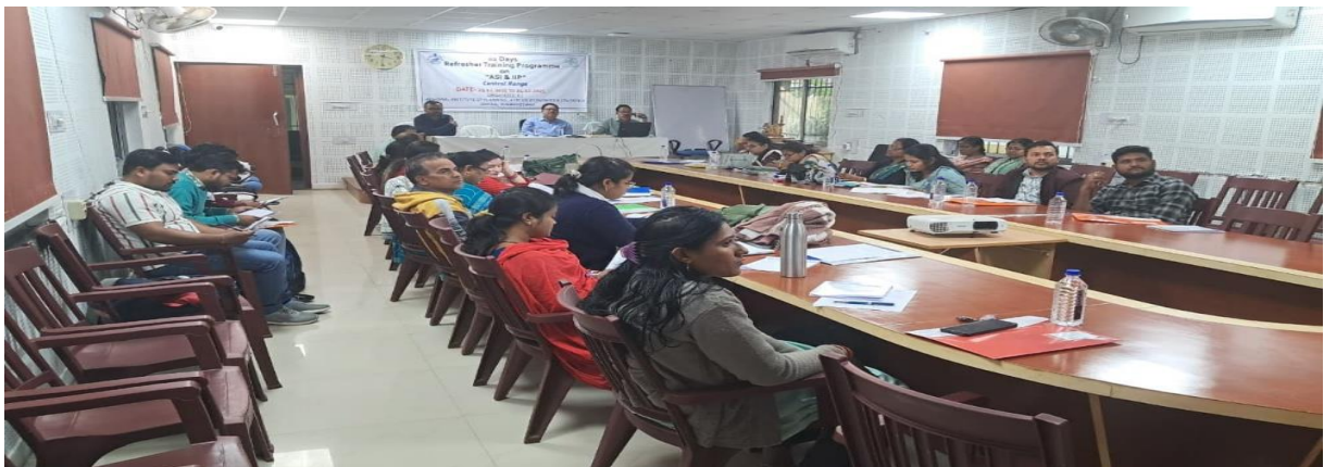
ASI ଏବଂ IIP ସମ୍ପନ୍ନୀୟ ରିପୋର୍ଟର ପ୍ରଶିକ୍ଷଣ

୧୦.୩୨ IIP (Index of Industrial Production) ୨୦୨୧-୨୨ ରିପୋର୍ଟ ପ୍ରକାଶ ପାଇଛି ।