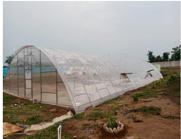
ସମନ୍ୱିତ ବର୍ଯ୍ୟବସ୍ଥୁ ଓ ପଙ୍କ ପରିଚାଳନା ବ୍ୟବସ୍ଥା, ଅନୁଗୁଳ