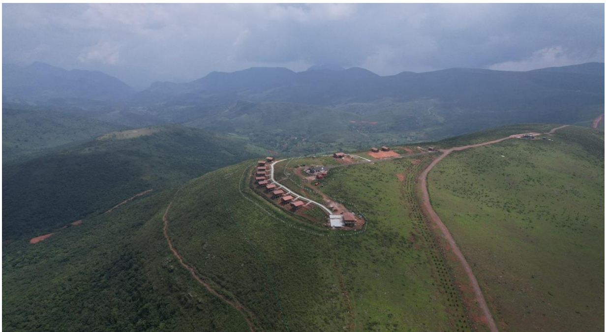
ଇକୋ ଟୁରିଜିମ, ଦେଓମାଳୀ, କୋରାପୁଟ