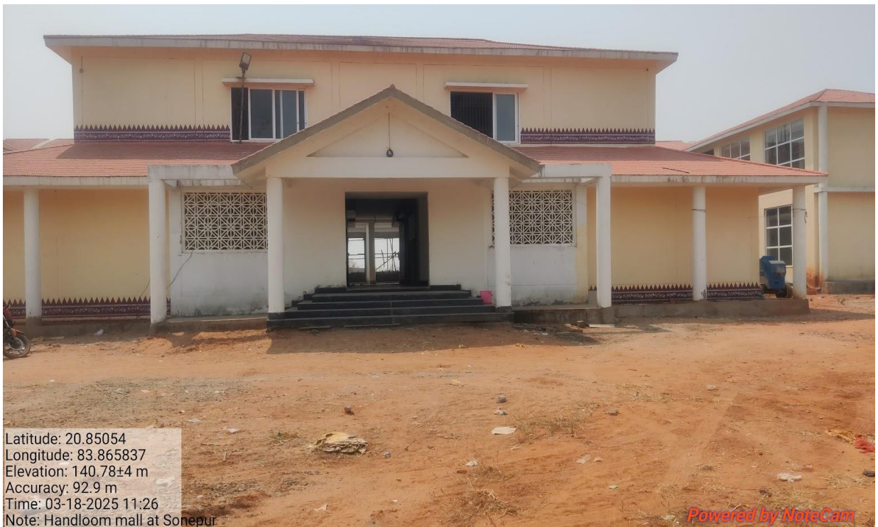
ହସ୍ତତନ୍ତ ଭବନ, ସୋନପୁର, ସୁବର୍ଣ୍ଣପୁର