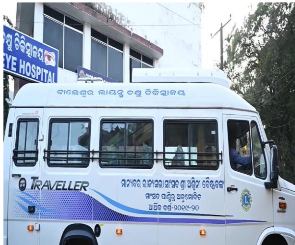
ବାଲେଶ୍ୱରର ଲାୟନ୍ସ କ୍ଲବ୍ ଚକ୍ଷୁ ଚିକିତ୍ସାଳୟ ନିମନ୍ତେ ଏମ୍ବୁଲେନ୍ସ ବ୍ୟବସ୍ଥା