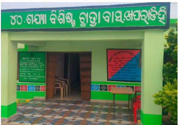
ଖପରାଡ଼ିହି, ITDA, ନବରଙ୍ଗପୁର