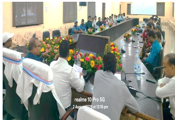
ଜୁଲାଇ ଓ ଅଗଷ୍ଟ, ୨୦୨୫ ରେ "Price Data Collection on Computer Assisted Personal Interview (CAPI) Mode" ସମ୍ବନ୍ଧୀୟ ଦ୍ୱି-ଦିବସୀୟ ପ୍ରଶିକ୍ଷଣ