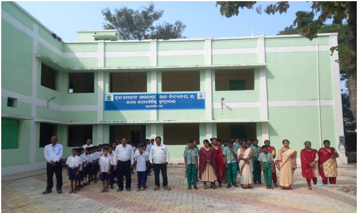
ବ୍ରଜ ମୋହନ ସରକାରୀ ଉଚ୍ଚ ବିଦ୍ୟାଳୟର ୧୦୦ ଶଯ୍ୟା ବିଶିଷ୍ଟ ଛାତ୍ରାବାସ, ଭବନୀପାଟଣା